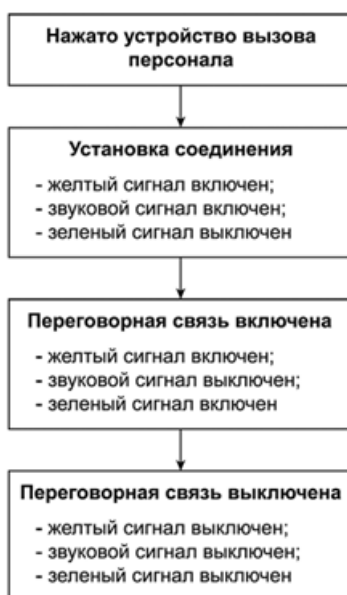
Рисунок 1 - Алгоритм формирования визуальных и звуковых сигналов

4.2.7 Устройство вызова персонала, расположенное в кабине лифта, должно быть желтого цвета и обозначено символом по ГОСТ 28911-2021 (приложение Д, таблица Д.1, символ 1 или 4). Допускается не окрашивать устройство вызова персонала желтым цветом при расположении рядом с устройством вызова персонала символа желтого цвета или символа на фоне желтого цвета.